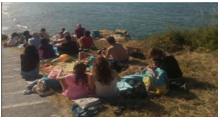
Vistas Praia de Area Longa - Fazouro