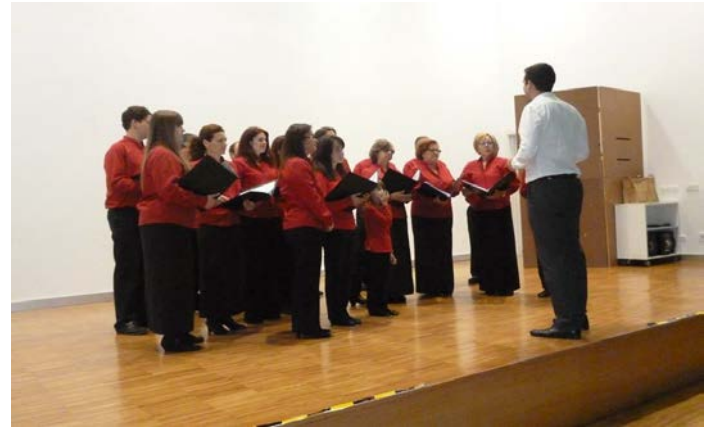
Coro Tanxedoira – Festival Fin de Curso